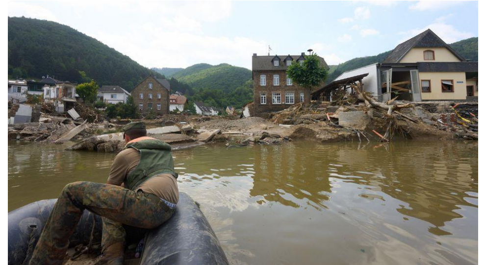
Die Ahrtalbrücke in Rech (Rheinland-Pfalz) ist durch das Hochwasser zerstört